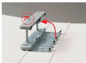
左側の矢印を上には引き上げると開きます。